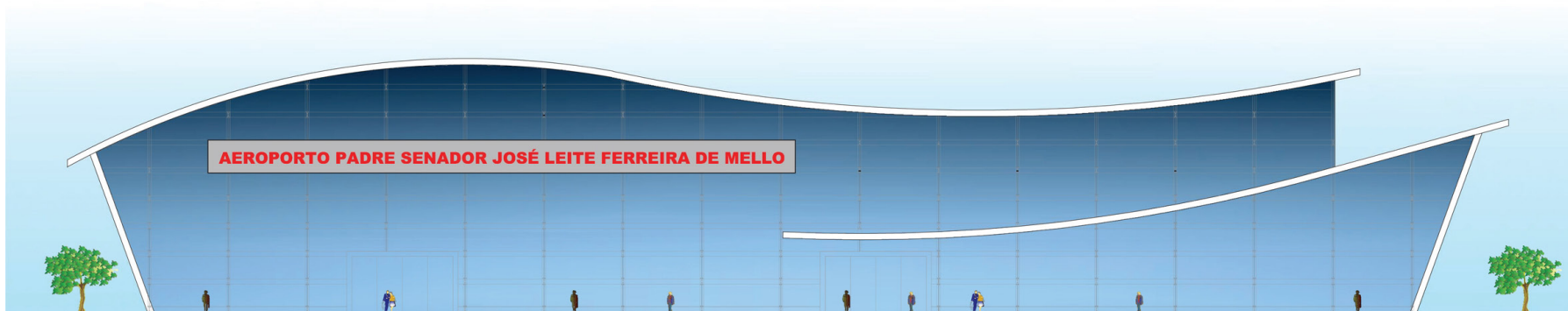
Imagem do Projeto da fachada do Aeroporto Internacional de Cargas de Pouso Alegre

Projeto inédito no país terá aeródromo com a maior pista do Brasil